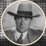
İNGİLİZ TURİST 1928