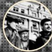
GURBET KUŞLARI 1964