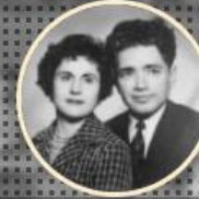
İŞİKÇİ AİLESİ 1946