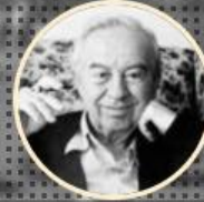
AYLAK ADAM 1959