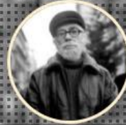
BİR LEVANTEN 1930/90