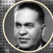
LÜTFİ KIRDAR 1949